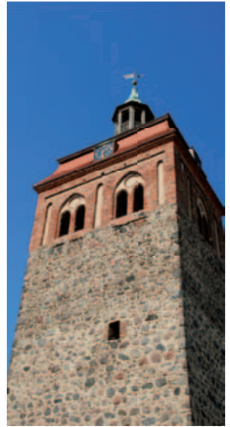
Rund um den steinernen Zeitzeugen wird sich beim 22. Luckenwalder Turmfest vom 15. bis 17. Juni 2012 wieder alles drehen.

Die Städtische Betriebswerke Luckenwalde GmbH (SBL) unterstützt das Luckenwalder Turmfest auch in diesem Jahr wieder als Sponsor. Wir wünschen den Luckenwalderinnen und Luckenwaldern sowie ihren Gästen drei unvergessliche Veranstaltungstage!